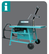
Zapfwellenanschluß RS 7-Z über Winkelgetriebe und Überlastkupplung, Dreipunktaufhängung mit Fahrwerk serienmäßig

1 Rolltisch auf Kugellager und mit spezieller Tischfixierung für schnellen Sägeblattwechsel