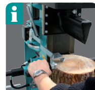
Jedes Holzstück kann mühelos durch die linke bewegliche Zweihandschaltung von oben gehalten und fixiert werden! (Serie bei 10t-24t)