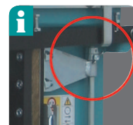
Fixierringe ermöglichen einfache und schnelle Einstellung der Höhen- bzw. Tiefenbegrenzung des Messers. (Serie bei 10t-24t)