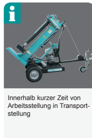
Innerhalb kurzer Zeit von Arbeitsstellung in Transportstellung

Unabhängig und beweglich! Der robuste HMG Holzspalteranhänger -bis 25 km/h- mit Zugöse oder Kugelkopfkupplung ermöglicht müheloses und schnelles Transportieren des HMG-Holzspalters. Eine einfache mechanische Schwenkvorrichtung -ohne aufwendige Hydraulikanlage- bringt das Gerät innerhalb kurzer Zeit in Arbeitsstellung. Die leistungsstarken Energiespar-Benzinmotoren oder Dieselmotoren bieten stromunabhängiges Spalten, egal wo. Mit Betriebserlaubnis 25km/h und Zugmaschine mit geeigneter Bremsanlage darf der Holzspalter auch auf öffentliche Straßen gefahren werden. Die Holzspalter sind lieferbar mit 10t, 13t oder 16t Spaltkraft. Ein funktionales Zweihandschaltungssystem ermöglicht müheloses Halten und Zentrieren von Meterholz oder Kurzholz, egal ob krume, dicke, astige oder dünne Holzstämmen, auch Schiebetechnik ist möglich. Die serienmäßigen Holzablegebügel fangen das gespaltene Holz auf, außerdem dienen sie auch zur Ablage von Holzstücken für weitere Spaltvorgänge. Der Antriebsmotor ist von verschiedenen namhaften Herstellern (z.B. Honda, Subaru Robin, Hatz, Briggs & Stratton) wählbar.